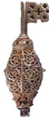
Figuur 1 Sleutel van Sint-Servaas

Eenzijds refereert “de tuinen” uiteraard direct naar het basisopzet, de moes- en fruittuin als kern, maar anderzijds knipoogt het ook naar een