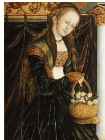
Figuur 2 Dorothea van Cappadocië met een mand vol appels en bloemen (Lucas Cranach, 1530)